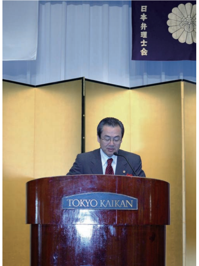
弁理士の日 記念祝賀会にて