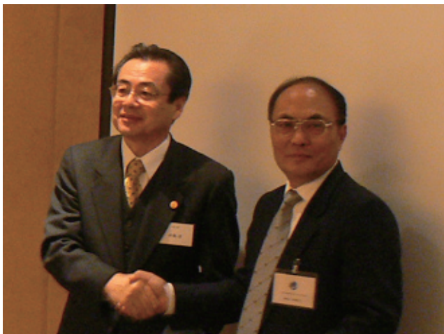
中華全国専利代理人協会の馬会長と 握手を交わす中島会長（日中弁理士交流会にて）