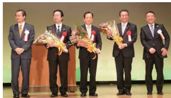
知財フォーラムやらまいか浜松にて