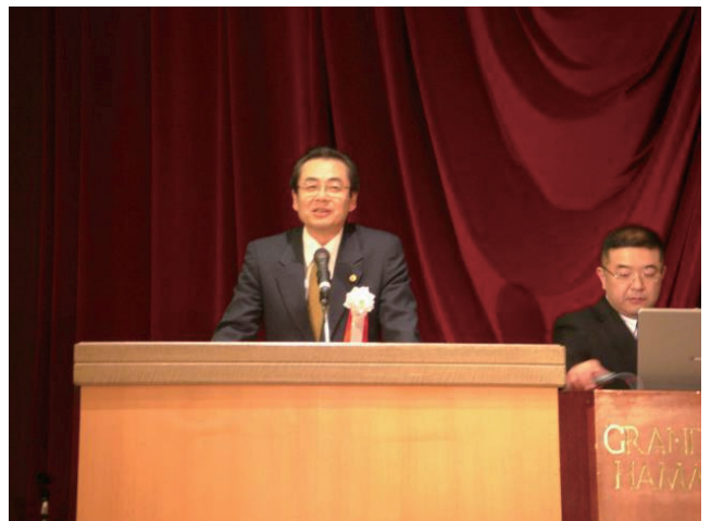
やらまいか浜松にて講演