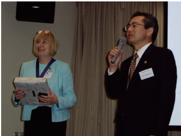
英国商標代理人協会との交流会