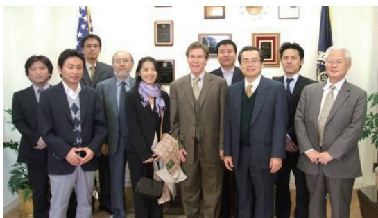
AIPLA アニュアルミーティング