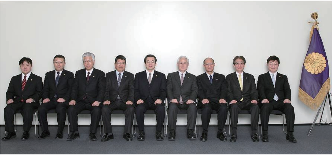
平成 20 年度日本弁理士会 執行役員会出発式

今年3月までの任期となる日本弁理士会の会長職において、数々の職務に東奔西走し業界を盛り立てる。