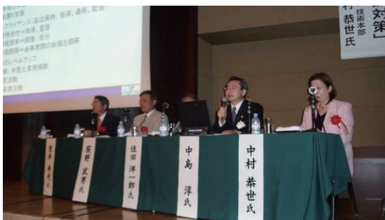
知財ものづくりシンポジウム in 広島