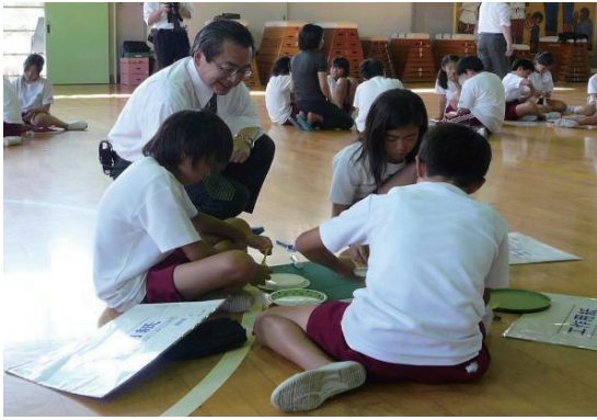
福島県三河台小学校にて 出張授業