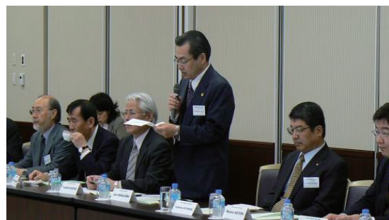
AIPLA 東京ミーティング