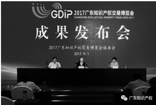
(図1:「広東省知的財産権取引博覧会」の記者会見の様子)

また、中国各地においても知的財産権の取引をテーマとしたイベントが多数開催されている。例えば、上海において「中国（上海）国際技術輸出入交易会」が開催され、深セン市において「中国国際ハイテク技術交易会」が開催され、大連市において「大連国際特許技術・製品交易会」が開催され、南京市において「紫金知的財産権国際サミット」が開催されている。紫金知的財産権国際サミットにおいて、日本ブランドである「ほにや（Honiya）」が中国市場におけるブランドの使用許諾権をオークションにかけた (3) 。日本企業は中国市場での知的財産権の取引活動におけるプレゼンスを高めている。